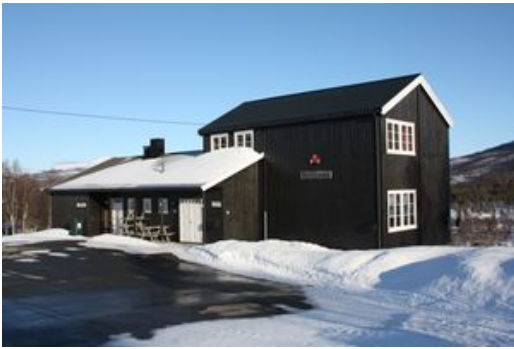
Forsamlingslokalet Fjellheim på Nerskogen