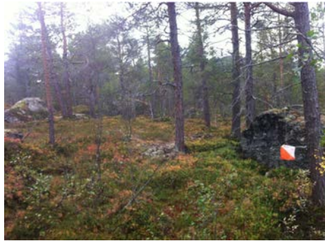
Terrenget på Oppdal